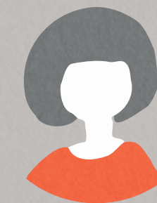
インターン生 大学4年生

今まで木彫刻についてあまり触れたことがなかったので、新しく知ることがたくさんあり、 楽しく学びながらプログラムに参加することができました 。欄間パズルやツアーなど、 木彫刻の魅力を多くの人に広めるための方法が、多様に存在すること に気づきました。