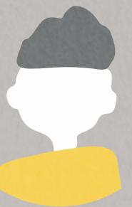
インターン生 大学2年生

よく考えたアイデアでも、実際に実行してみると 思案時には気づかなかった改善点が見つかった ことから、想像を膨らませるだけでなく、それを実行して more(もっとこうしたら良くなる点) を探すことが 大事だ と実感しました。