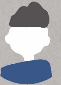
インターン生 大学2年生

大学の授業で伝統産業について触れてはいましたが、 職人さんのお話を聞いたり、共に何かをすることは初めてだったので、今回素晴らしい経験ができました。 自分の頭の中で思いついたことをグループに共有することで、 より多角的な考えを得ることができる と学べたので、今後実践していきたいです。