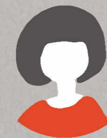
インターン生 大学3年生

ニッチに考える というのが自分の中でキーワードだと思いました。 ターゲットを絞ったり、オリジナリティーを出したりすることで、コアなファンをつけられる ということが分かりました。