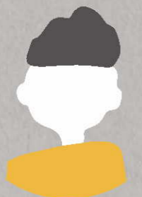
インターン生 大学3年生

仏像彫刻の工房で、使用できる技術に制限があるとなると、商品開発が難しいのかなと思っていました。しかし、順を追って、ワークシートを用いて考えていくと、 短い時間の中でも面白いものが考えられる と分かりました。